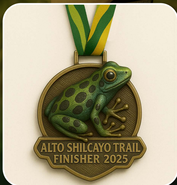
Imagen referencial, puede variar ligeramente.

Al cruzar la meta, en reconocimiento a tu esfuerzo, recibirás una medalla coleccionable, y cada año será una especie distinta. Este 2025 empezamos con la Ranitomeya variabilis .