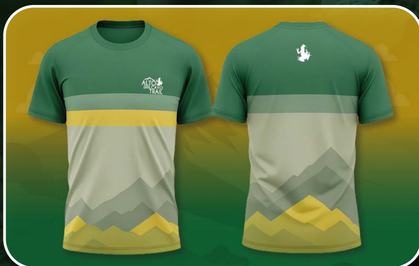
Imagen referencial, puede variar ligeramente.

Cada corredor recibirá su polo al momento del recojo de kits.