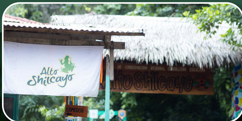
Circuitos Ecoturísticos Alto Shilcayo ( Clic aquí )

Desde tu ubicación, indica al mototaxista que te lleve hacia los Circuitos Ecoturísticos Alto Shilcayo. El precio puede variar según tu ubicación, por lo que te recomendamos preguntar a la organización para obtener un costo aproximado. Si el mototaxista no conoce el destino, infórmale que el lugar se encuentra a aproximadamente 600 metros más allá del Centro de Rescate Urku.