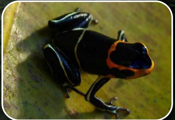
Ranitomeya Fantástica White Banded